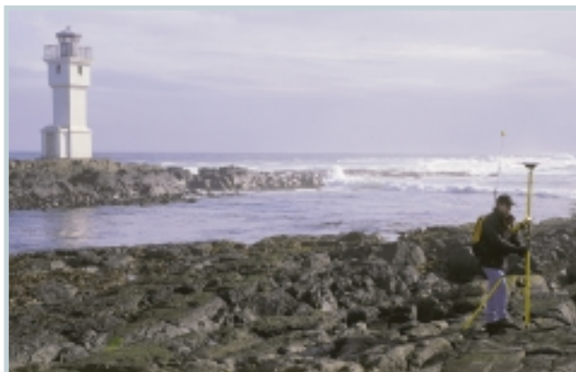
Gamli vitinn á Akranesi.

Að sögn Þórarins er hafinn undirbúningur fyrir endurmælingu á grunnstöðvanetinu sem áætlað er að fari fram sumarið 2003. Mælingar á grunn-