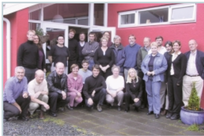
Fundur norrænna tæknimanna var haldinn á Hótel Glym.