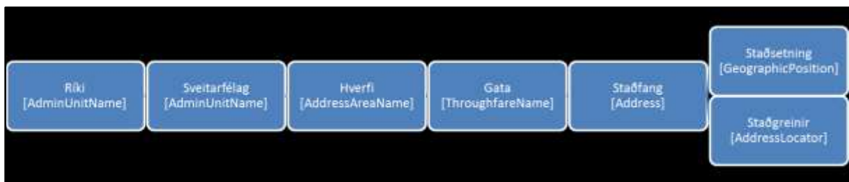
MYND 2: SAMRÆMI STAÐFANGASKRÁR VIÐ INSPIRE

Gagnalíkan staðfangaskrár Þjóðskrár Íslands er sambærilegt því sem finna má hjá INSPIRE, sjá mynd 1.